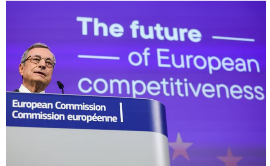
El Informe Draghi se presentó en septiembre de 2024.

En 2023, la Comisión Europea encarga al economista Mario Draghi, ex primer ministro de Italia y expresidente del BCE, un análisis para “revitalizar” la economía europea.