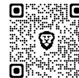
Base de datos de préstamos chinos a África.